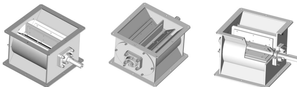
Passage direct - Rotor Ouvert Direct passage - Opened rotor